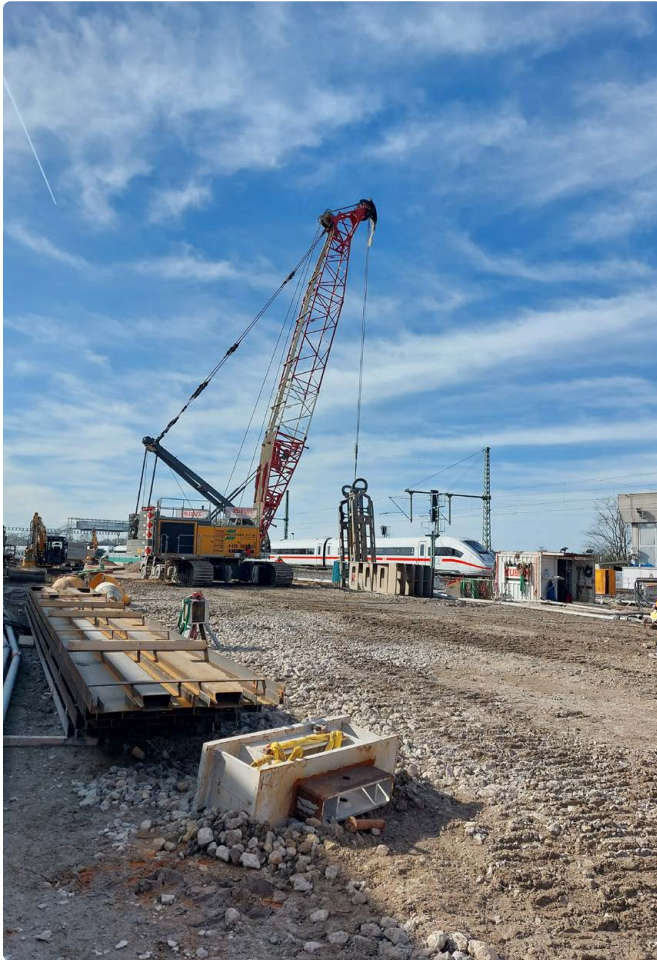
Meilenstein erreicht: Die Arbeiten für die Baugrubenumschließung sind abgeschlossen.