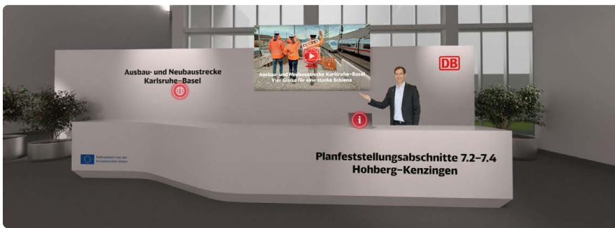
Die Infostände im digitalen Marktplatz besuchen.

... weiter von Seite 1: Deutsche Bahn kommt mit rund 650 Besucher:innen ins Gespräch