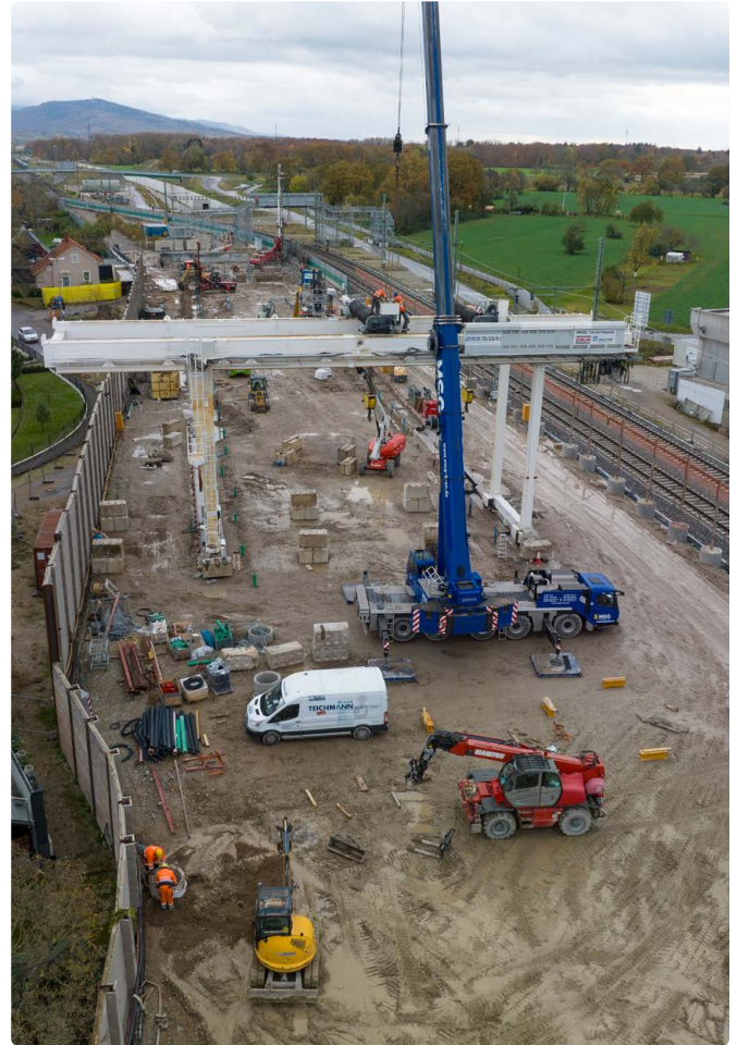
Die einzelnen Komponenten des Krans wurden vor Ort zusammengesweißt.

In Niederbühl baut die Deutsche Bahn (DB) die letzten 200 Meter der Oströhre in offener Bauweise. Um die Baugrube vor Grundwasser zu schützen, hat sie sogenannte Schlitzwände hergestellt. Ende Oktober beendete die DB nach über einem Jahr die Arbeiten dafür. Die künftige Baugrube ist nun komplett von Wandelementen umschlossen.