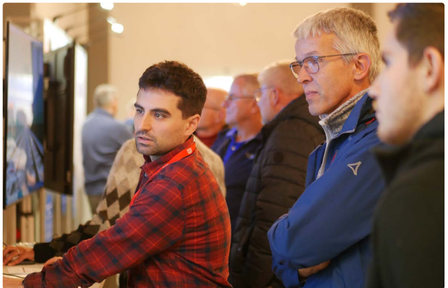
Besucher:innen im Gespräch mit dem Projektteam

Die Deutsche Bahn (DB) plant zwischen Hohberg und Kenzingen zwei neue Gleise parallel zur Bundesautobahn 5. Die Neubaustrecke führt den Güterverkehr damit abseits bewohnter Gebiete in Richtung Freiburg. Anschließend baut die DB die Rheintalbahn aus. Das schafft mehr Kapazität und kürzere Reisezeiten im Personenverkehr.