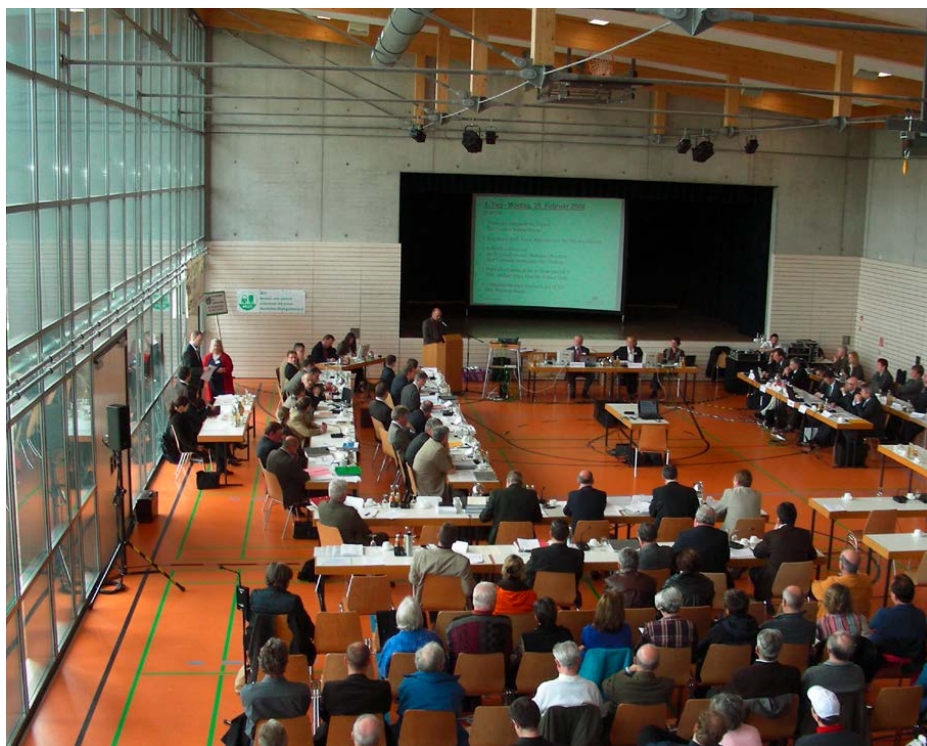
Bürgerinnen und Bürger werden bei regelmäßigen Veranstaltungen über den aktuellen Projektstand informiert.

geprüft und an die zuständigen Anhörungsbehörden – also Bezirksregierungen oder Regierungspräsidien – weitergeleitet. Diese veranlassen die einmonatige Offenlage der Unterlagen in den Kommunen. Während dieser Zeit können die Bürgerinnen und Bürger Einsicht in die Unterlagen nehmen und ihre Einwendungen gegen das Vorhaben geltend machen. Zu allen Einwendungen werden dann seitens der Deutschen Bahn Stellungnahmen abgegeben.