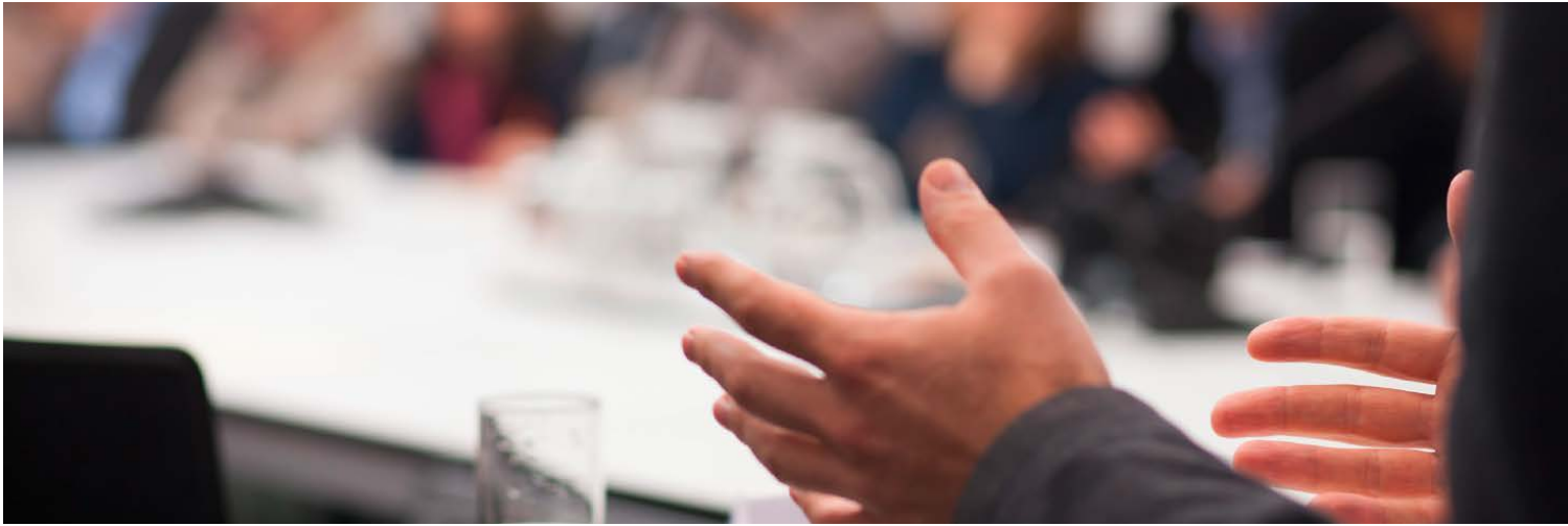
Gesetzliche Verfahren mit verschiedenen Beteiligten begleiten das Großprojekt von Anfang an.

dierte ökonomische und auch ökologische Planungen schaffen die optimalen Rahmenbedingungen für derartige Großprojekte. In mehreren Verfahrensstufen werden die Vorhaben Schritt für Schritt vorangebracht.