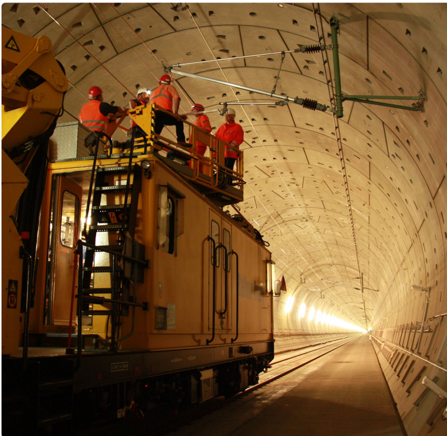
Oberleitungsarbeiten im Tunnel

Wir wissen, dass diese Arbeiten Lärm und Einschränkungen mit sich bringen. Deshalb setzen wir einen mobilen Lärmschutz ein, um die Belastungen so gering wie möglich zu halten.