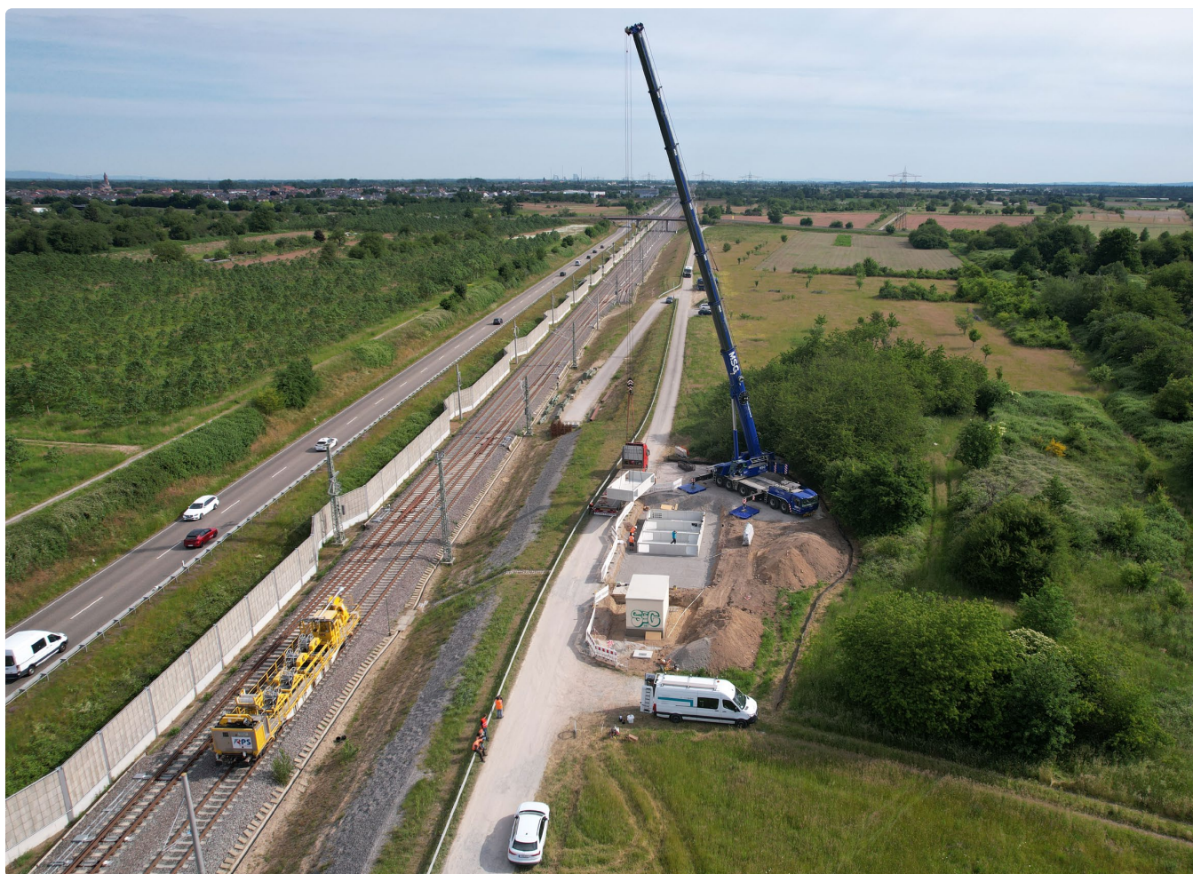
Blick auf das elektronische Stellwerk Kreuzacker.

Unser Ziel bleibt klar: Die ersten Züge sollen wie geplant im Dezember 2026 durch den Tunnel Rastatt fahren.