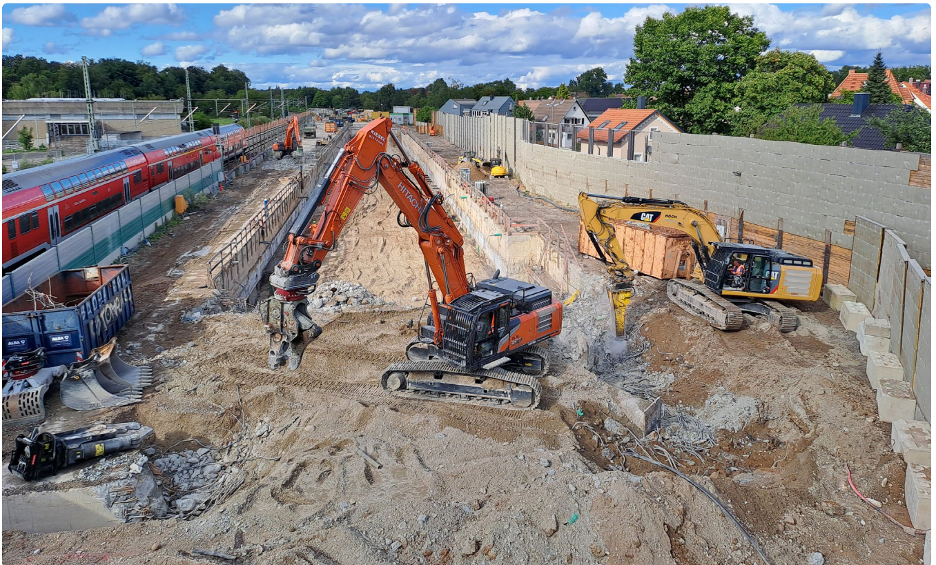
Im Vordergrund Abbrucharbeiten der Schlitzwand

Auch die Baustraßen entlang der Bau- grube wurden bereits zurückgebaut.